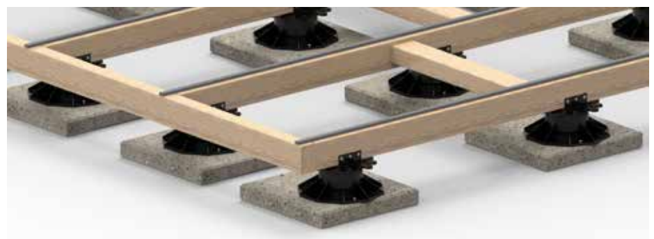
Für die Windsogsicherung müssen je nach Gebäudehöhe die Verstellfüße auf den Betonplatten verschraubt werden.