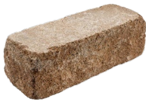
37 x 12,5 x 12,5 cm