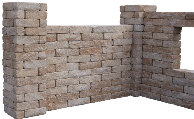
Sahara-Weiß-Melange ANTIK (Pfeiler)