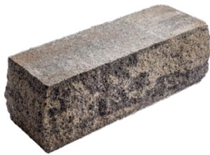
37 x 12,5 x 12,5 cm